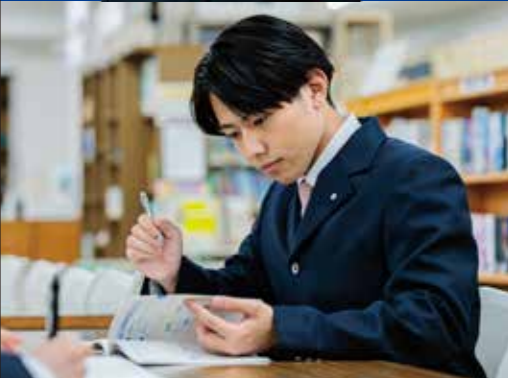
普通科 アドバンスコース

本校は、普通科・家政科・商業科の3学科で構成され、普通科にアドバンスコース・留学コース・進学コース・スポーツサイエンスコースの4コース、家政科と商業科には、それぞれ生活デザインコースと総合ビジネスコースを設置。生徒一人ひとりの可能性を引き出す充実のコース編成となっています。進学コースとスポーツサイエンスコースは、1年次は共通で学習し、2年次より分かれます。