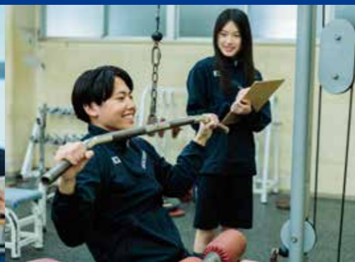
普通科 スポーツサイエンスコース

大学・短大・専門学校への進学を目標としながら、多様な進路にも対応できるカリキュラム編成です。