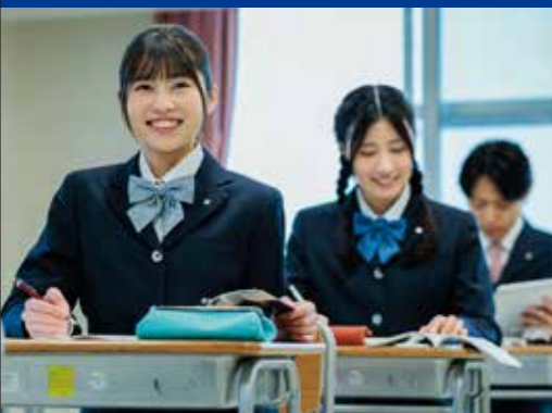
普通科 進学コース

クラス全員が、1年間ニュージーランドの高等学校へ留学します。国境を越えたグローバルな視野を持つ国際人を育成します。