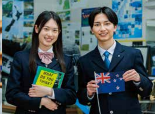
普通科 留学コース

難関大学への進学を目指し、より高い学力を養います。週34時間の授業で、基礎から応用までじっくりと学習します。