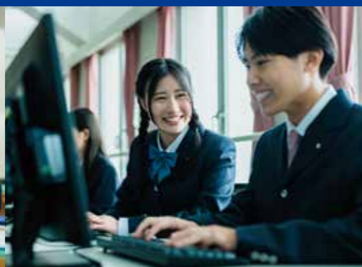
商業科 総合ビジネスコース

衣・食・住に「遊」を加え、生活をデザインする基礎力を育み、豊かな人間性と自主性を養います。