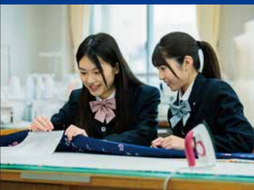
家政科 生活デザインコース

各種スポーツの技能習得を通じて生徒の能力を高めます。指導者を目指す人材の育成を図ります。